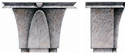
Obětní stůl - zděná podnož, omítka, deska kámen (žula)

Před námi jsou opravy vnitřních omítek a elektroinstalace, včetně nového vytápění a osvětlení. Na sklonku léta budeme vyměňovat část oken. Výmalbu chrámu, bezmála po 50 letech, dá-li Pán uskutečníme letos v listopadu.