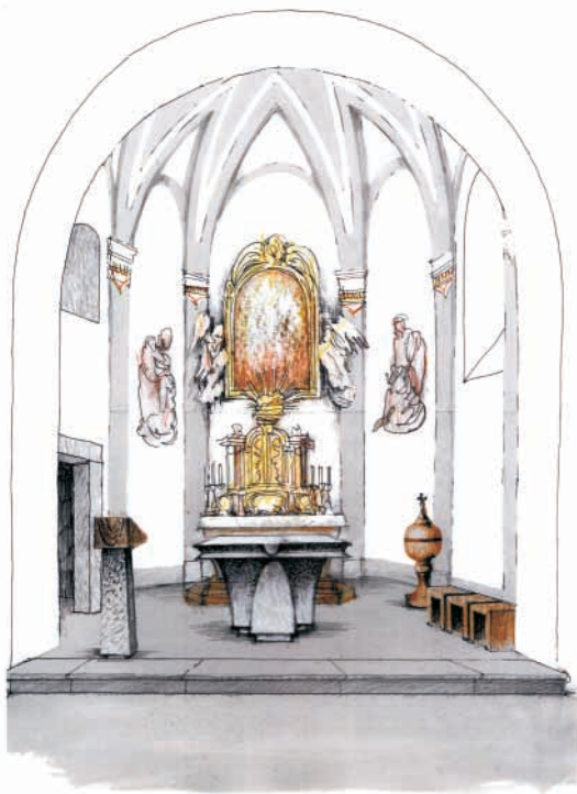
Barevná a skladebná studie presbytáře